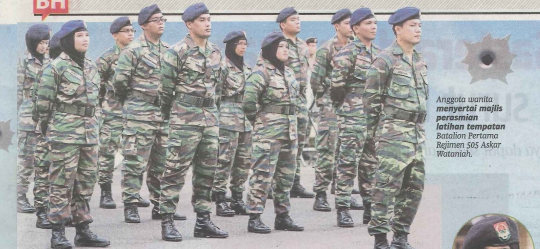
Anggota wanita menyertai majlis persembahan latihan tempatan Batalion Pertama Rejimen 505 Askar Wataniah.