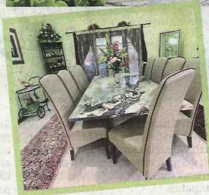
Susun atur perabot kemas dan teratur mudahkan pergerakan.

raan di ruang ini dikategorikan sebagai ruang aplikasi teknikal. Keadaan bilik air yang lembap dan basah memberikan risiko tinggi untuk berlakunya kemalangan. Justeru, bagi memastikan bilik air selamat, rancanglah keperluannya dengan memastikan ia bersih dan segar. Kebersihan jubin dan mengadakan pelapik antigelincir adalah untuk menjamin keselamatan.