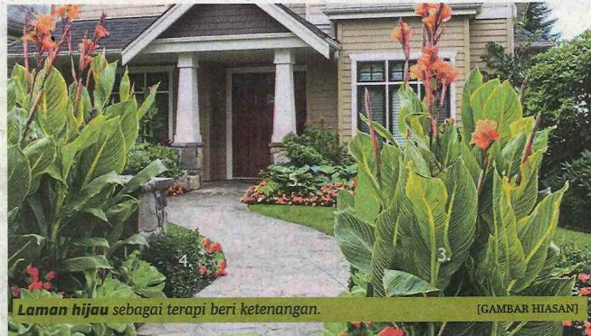
Laman hijau sebagai terapi beri ketenangan.

Bilik air ialah ruang yang sering digunakan. Kerja-kerja penyelenggara-