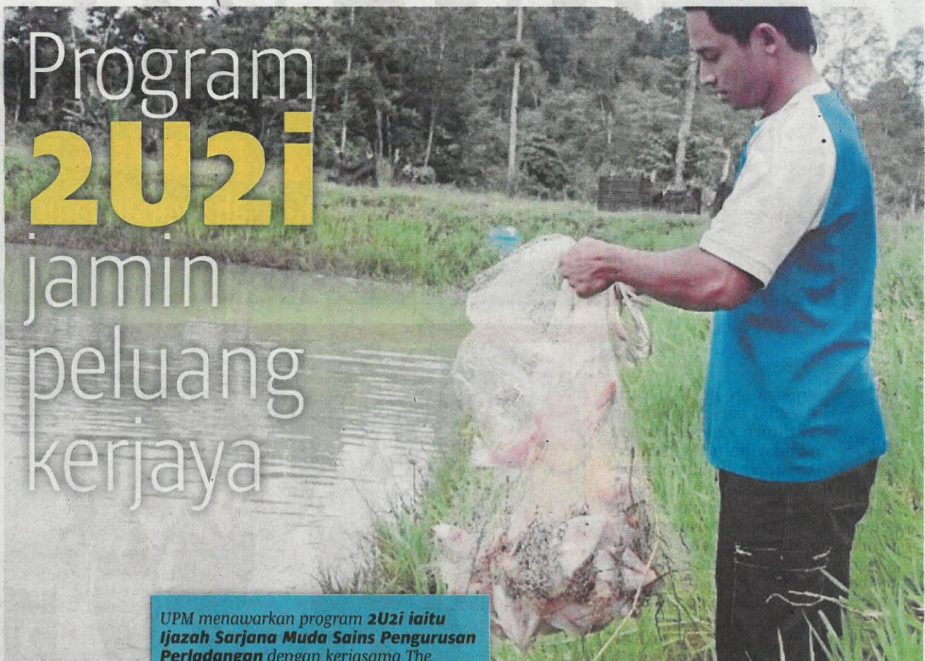
UPM menawarkan program 2U2i iaitu Ijazah Sarjana Muda Sains Pengurusan Perladangan dengan kerjasama The Incorporated Society of Planters.

“Mungkin tidak semua program sesuai melaksanakan pendekatan ini. Antara