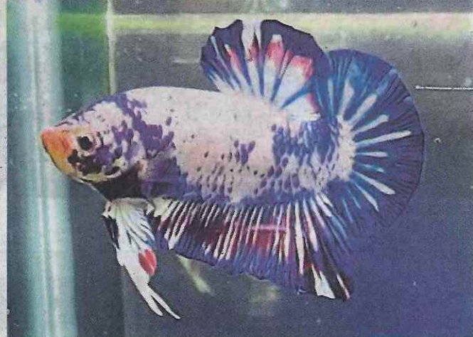
IKAN laga Betta Giant.

Proses penjagaan BG lebih lama selain berhadapan risiko ikan mati sebelum mencapai usia matang