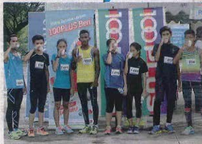
SEBAGIAN peserta larian Fun Run menghilangkan dahaga dengan minum air tajaan 100 Plus di Universiti Malaysia Pahang (UMP), Kuantan, Pahang, semalam.