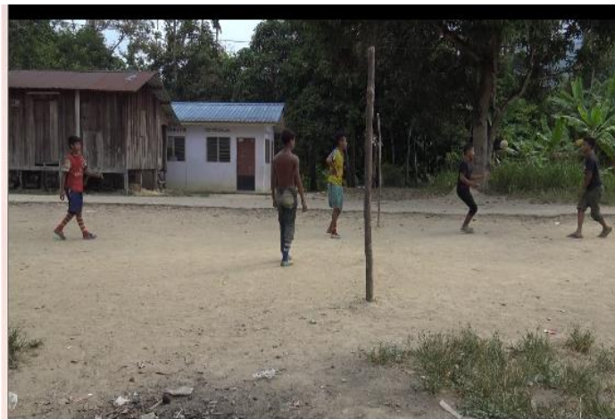
Gambar 3: Golongan belia masyarakat Che Wong sedang bersukan (sepak takraw)

Golongan belia ini juga menyatakan mereka gembira bekerja dengan pihak luar. Contohnya, ada dalam kalangan mereka yang bekerja dengan Pusat Jagaan Gajah yang terletak berhampiran dengan penempatan mereka. Mereka bukan sahaja memperolehi pendapatan tetap malah gembira kerana dapat bertemu dengan ramai pelancong yang melawat kawasan ini. Selain itu, ada juga dalam kalangan mereka yang berkerja dengan individu dan orang perseorangan untuk mengusahakan kebun sayuran dan kelapa sawit. Manakala golongan berusia 51 tahun ke atas iaitu hanya sebanyak 10% masih melakukan aktiviti harian biasa masyarakat ini untuk meneruskan keberlangsungan hidup mereka.