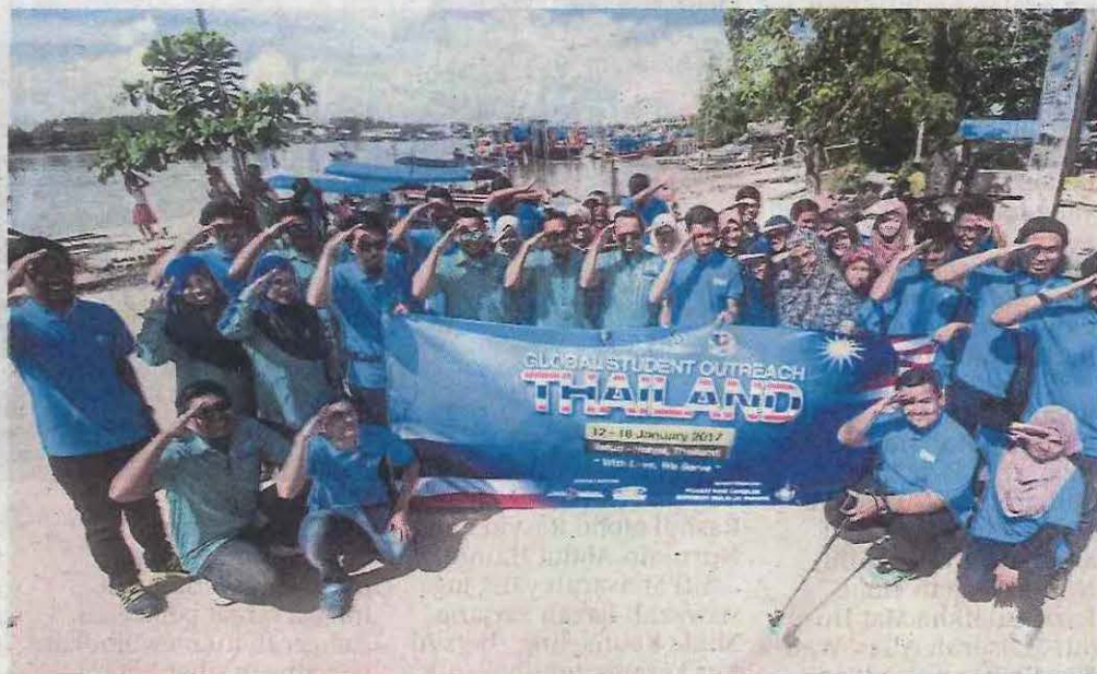
Peserta program mengabadikan kenangan di sekitar Kampung Tammalang.

"Lebih 1,000 orang dalam kalangan masyarakat setempat hadir dalam Forum Perdana disampaikan penceramah jemputan, Pencetus Ummah (PU) Muhammad Hafiz Mohd Haneefa yang banyak berkongsi kisah Nabi Muhammad SAW dan sumbangan baginda kepada Islam sejagat," katanya.