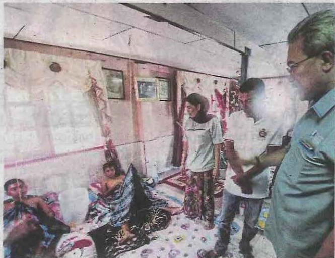
Melawat kanak-kanak yang baru dikhatakan.

BERITA HARIAN VARSITI KEMBARA/GLOBAL 2 FEBRUARI 2017 V9