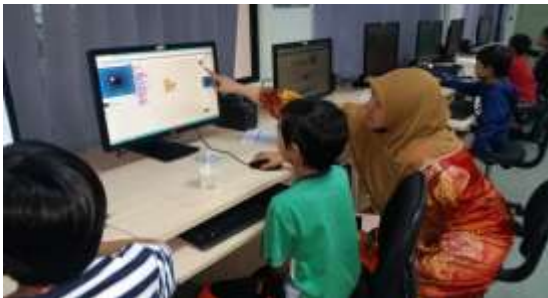
(a) Aksi murid dan fasilitator

Kaedah pedagogi yang digunakan lebih berfokus kepada demonstrasi dan latihan tutorial supaya tidak banyak perbezaan dengan pdp di sekolah. Tugasan-tugasan kecil diberi untuk melihat keupayaan murid memanipulasi dan mengubah sesuatu mengikut kehendak yang dinyatakan. Pemerhatian dibuat secara langsung.