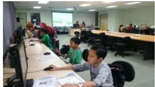
(b) Suasana ketika bengkel