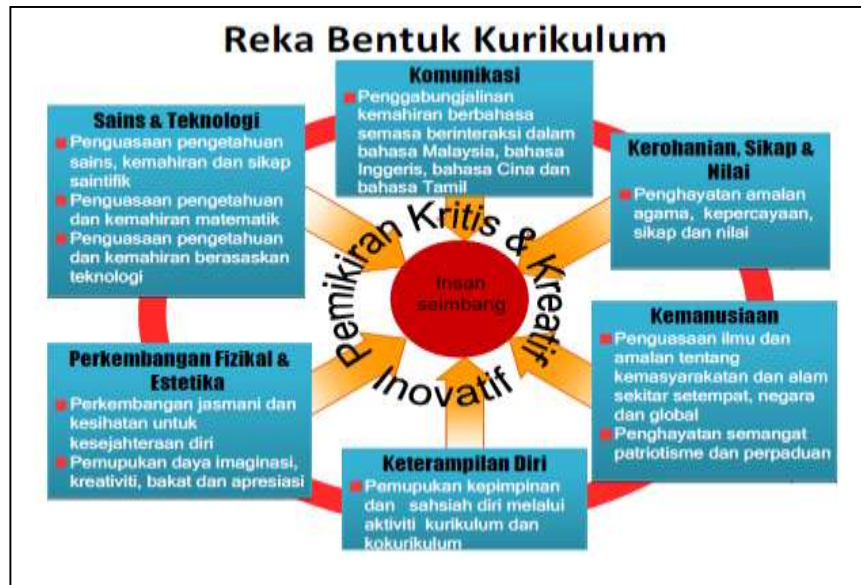
Rajah 1: Reka bentuk kurikulum prasekolah dan sekolah rendah mengikut struktur Kurikulum Standard Prasekolah Kebangsaan (KSPK) dan Kurikulum Standard Sekolah Rendah (KSSR) (Kementerian Pelajaran Malaysia, 2010).

Kurikulum Standard Sekolah Menengah (KSSM) pada 2017 dalam usaha kementerian untuk melonjak sistem pendidikan negara (Utusan Malaysia, 12 September 2012). KSSR menggantikan Kurikulum Bersepadu Sekolah Rendah (KBSR) yang telah diguna pakai semenjak tahun 1988. Perancangan kali ini banyak tertumpu kepada pembentukan kebolehan dan kemahiran murid yang sesuai untuk bersaing di peringkat lebih global; ia meliputi dimensi murid yang lebih luas dan holistik, di samping membentuk kebolehan mengaplikasi pengetahuan dan kebolehan berfikir secara kritis, kreatif serta inovatif.