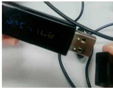
Rajah 1: Alat HeartMath Em Wave

Bagi kajian eksperimental klinikal pula, alat kajian yang digunakan adalah alat Heart mart biofeedback berserta dengan perisian yang telah diprogramkan di dalam komputer riba pengkaji. Bacaan nilai HRV responden diambil sebelum dan selepas kajian. Alat kajian yang digunakan dalam kaedah ini ditunjukkan dalam rajah di bawah