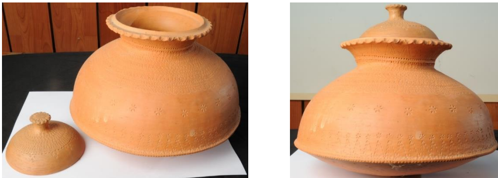
Rajah 2: Terenang tradisional

Di sini terlihat kepakaran penggiat kerana bijak membentuk Terenang dengan baik walaupun dihasilkan dengan saiz besar dan mempunyai rupa bentuk yang rumit dengan bentuk cembung serta cekung. Kepakaran membuat ini bukan boleh didapati dalam jangka masa yang pendek kerana ia kebolehan yang dipelajari, diasah dalam jangka masa yang lama. Oleh itu kebolehan membuat Terenang ini merupakan satu kemahiran individu yang mewujudkan keunikan pada reka bentuk Terenang berdasarkan pada individu yang membuat. Keunikan ini menampakkan kehalusan kerja yang menjadikan Terenang itu indah dipandang mata. Walaupun bentuk asas tembikar tersebut kelihatan