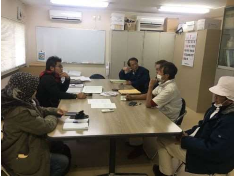
Perbincangan bersama Pengurusan Atasan Zenkai Meat Corporation