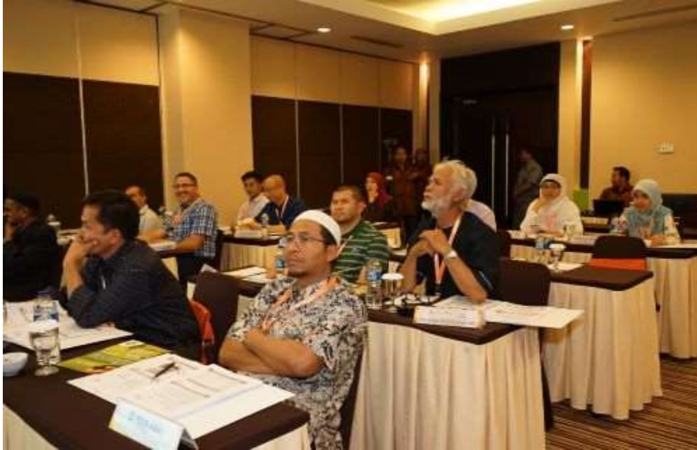
Sesi Latihan untuk juruaudit halal anjuran Majelis Ulama Indonesia (MUI)