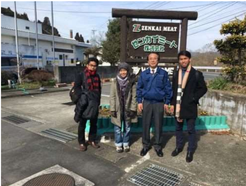
Bergambar bersama Pengurusan Atasan Zenkai Meat Corporation dan auditor MPJA