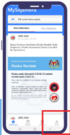
LANGKAH 1 TEKAN BUTANG 'PROFIL'