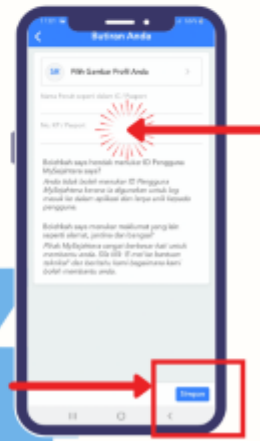
LANGKAH 4 KEMAS KINI MAKLUMAT ANDA & TEKAN BUTANG 'SIMPAN'