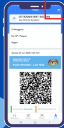
LANGKAH 2 TEKAN BUTANG 'ATURAN'