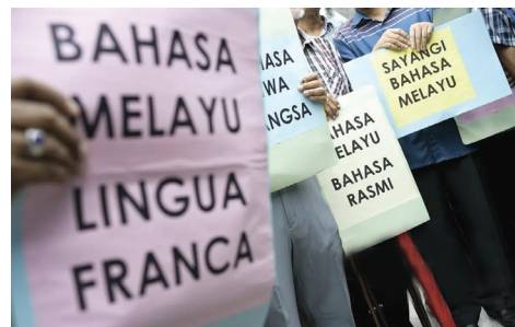
Kedudukan bahasa kebangsaan sebagai wadah integrasi nasional perlu diperkasakan di negara ini.

Peranan Yang di-Pertuan Agong dalam pemeliharaan kedudukan elemen struktur asas Perlembagaan Persekutuan seperti bahasa Melayu juga termaktub dalam Perkara 153. Perkara 153 menyentuh kedudukan istimewa orang Melayu serta anak-anak negeri dan kepentingan sah kaum-kaum lain berwarganegara Malaysia.