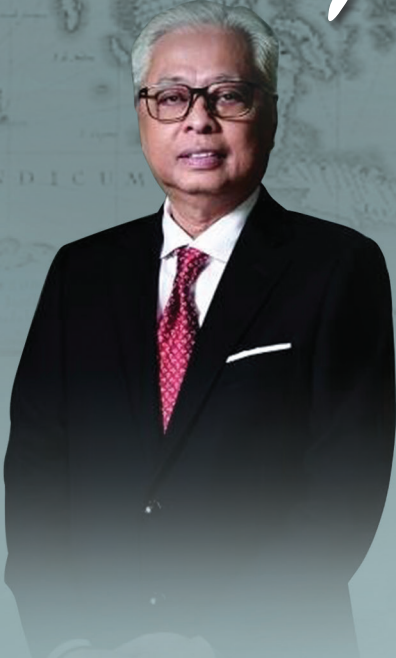
YAB Dato' Sri Ismail Sabri Yaakob, Perdana Menteri Malaysia.

Bahasa Melayu bukan sahaja alat komunikasi dan penyatuan jiwa yang digunakan oleh kerajaan yang menguasai alam Melayu selewat-lewatnya pada kurun ketujuh Masihi, malah turut digunakan oleh alam Melayu pada zaman kemuncak kerajaan Melayu Lama merentasi wilayah politik yang kini dikenali sebagai Malaysia, Indonesia, Brunei Darussalam, Singapura, sebahagian Filipina dan beberapa buah negara di Indo-China.