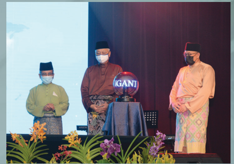
Pelancaran Simposium Pengantarabangsaan Bahasa Melayu disempurnakan oleh YAB Dato' Sri Ismail Sabri Yaakob.