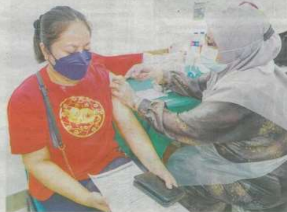
HANYA 50 peratus penduduk Malaysia mengambil dos penggalak pertama dan kedua Covid-19.

Selain kesan PKP, peningkatan kanak-kanak yang tidak divaksin juga disebabkan oleh faktor vaccine