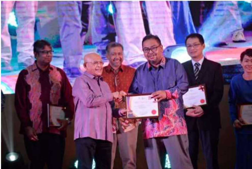
Discovery of new knowledge in impactful journal writing

pelajari. Di sini kita dapat melihat kemampuan pelajar IPT dalam membantu bukan sahaja universiti mereka, malahan ada antara mereka yang mampu mencipta nama di luar negara.