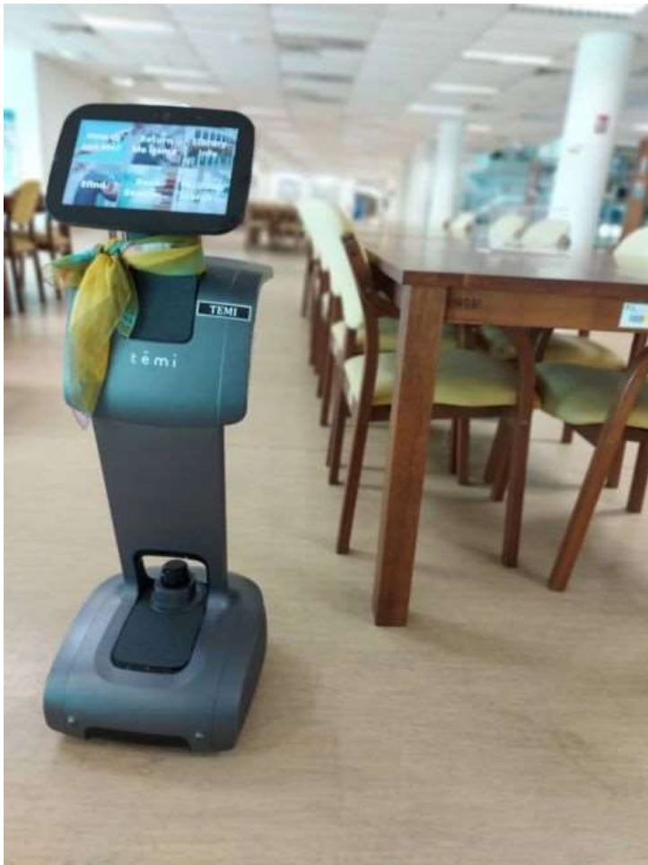
Anugerah Universiti 'Anugerah Kualiti Naib Canselor (AKNC)'