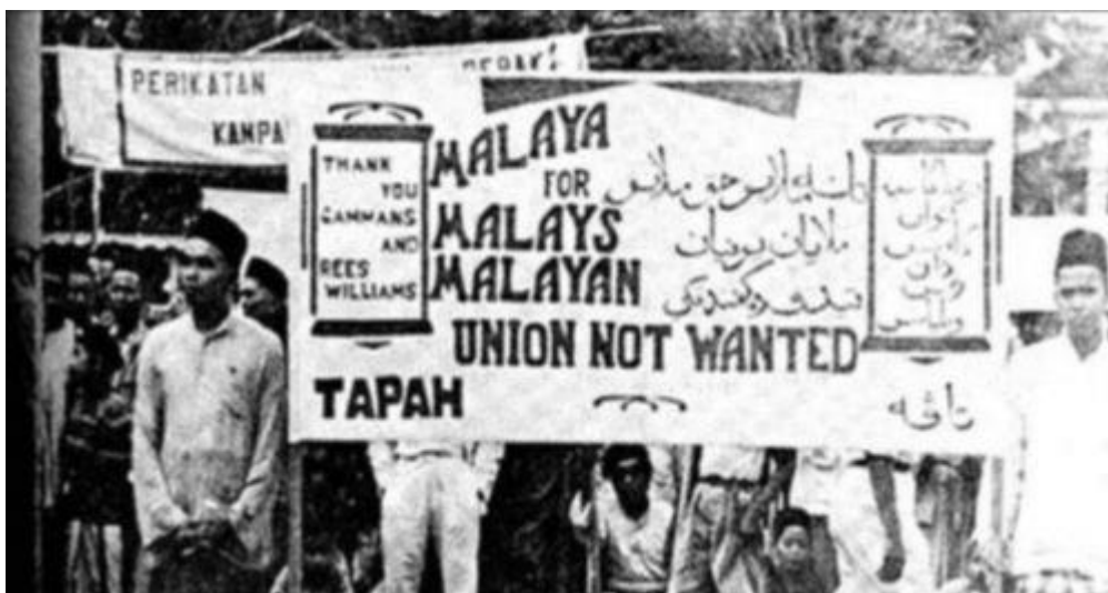
Gambar penentangan orang Melayu terhadap Malayan Union

tetap ada kepentingan di situ dengan wujudnya jawatan Pesuruhjaya Tinggi British serta Majlis Mesyuarat Persekutuan dan Majlis Perundangan Persekutuan dan jawatan-jawatan penting dalam negara adalah terdiri dari pegawai British. Ini menunjukkan British masih menguasai keseluruhan pentadbiran negara ini. Boleh rujuk kepada Perlembagaan Malayan Union 1946 dan Perlembagaan Persekutuan Tanah Melayu 1948. Secara ringkasnya, pembentukan Malayan Union dan pembentukan Persekutuan Tanah Melayu telah menghapuskan tiga bentuk pentadbiran sebelum ini yang dikelompokkan sebagai negeri jajahan dan negeri naungan. Semua negeri telah dikuasai oleh British di bawah satu pentadbiran yang diketuai oleh Pesuruhjaya Tinggi British dan dikawal oleh Pejabat Kolonial di London.