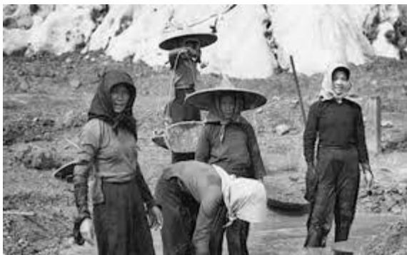
Masyarakat Cina yang bekerja di lombong bijih timah

Kedatangan British telah mewujudkan perbezaan pembangunan yang ketara di antara kawasan kampung dengan kawasan yang menjadi pusat tumpuan perkembangan ekonomi British. Pengenalan ekonomi perlombongan bijih timah dan perladangan getah telah mewujudkan jaringan sistem perhubungan jalan raya dan jalan kereta api bagi menghubungkan kawasan berkenaan dengan pelabuhan.