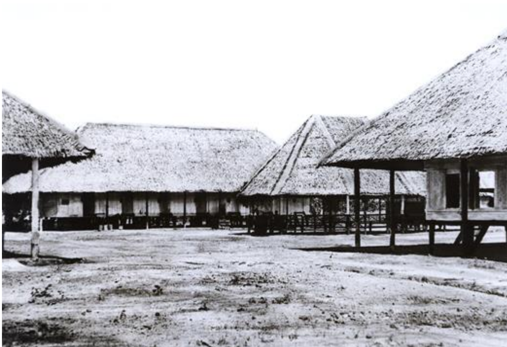
Berek buruh estet getah

Apabila perlombongan bijih timah dan perladangan getah semakin berkembang, lebih banyak jalan raya dan jalan kereta api dibina bagi menghubungkan sebuah bandar dengan bandar yang lain dan juga menghubungkan kawasan perlombongan dengan pelabuhan. Keadaan ini secara tidak langsung telah mewujudkan bandar-bandar baru seperti Kuala Lumpur, Ipoh, Taiping, Teluk Anson dan Seremban. Bandar-bandar ini juga telah dijadikan sebagai pusat pentadbiran pihak British. Antara negeri-negeri yang menjadi tumpuan pembangunan ekonomi British pada masa itu ialah negeri Perak, Selangor, Negeri Sembilan dan Johor iaitu negeri-negeri ini merupakan pusat perlombongan bijih timah dan perladangan yang moden.