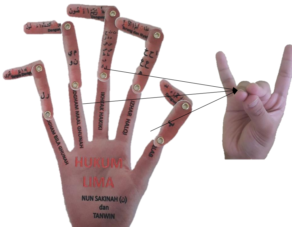
Gambar 3: Penggunaan model tangan inovasi Tajwid Yadun bagi menjelaskan hukum bacaan dengung.

lawannya apa?, pasti pelajar-pelajar akan menjawab tanpa dengung atau tidak dengung” secara tidak langsung memudahkan pelajar untuk mengingat cara bacaan ini. Cara bacaan yang ke tiga yaitu jelas, bagi hukum Izhar Halqi diletakkan pada jari telunjuk. Penerangan guru tentang bacaan jelas bagi Izhar Halqi ini, disertakan dengan perlakuan aksi seolah-olah sedang menunjukkan sesuatu dengan menggunakan jari telunjuk memudahkan dan menguatkan ingatan pelajar. Sekali lagi teknik kata penghubung dalam kaedah mnemonik diterapkan dalam pengajaran iaitu mengaitkan atau mengasosiasikan satu kata dengan kata yang lain melalui sebuah aksi atau gambaran (Maizan Mat@Muhammad 2017). Gambar 3 dan 4 menunjukkan cara pengajaran cara bacaan bagi setiap hukum tajwid.