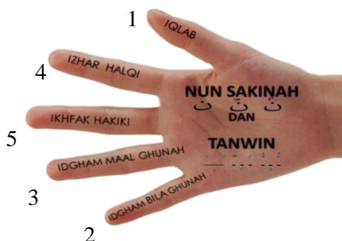
Gambar 1: Pengajaran tahap pertama model tangan inovasi Tajwid Yadun

Guru perlu membiasakan pelajar dengan susunan yang diatur mengikut saiz ukuran ketinggian jari bagi memantapkan lagi daya ingatan mereka tentang nama-nama hukum tajwid. Teknik kiraan satu hingga lima boleh digunakan bagi memudahkan lagi proses ingatan nama hukum tajwid, dengan cara kesemua jari digenggam dan diangkat satu persatu bermula dari jari yang paling pendek mewakili nombor satu hinggalah jari yang paling panjang merupakan nombor lima. Kajian Mohd Romei Ngah (2012) menjelaskan, masalah mengingat merupakan satu cabaran yang besar kepada pelajar dalam mata Pendidikan Islam kerana mengandungi pelbagai topik yang mempunyai banyak fakta. Gambar 1 menjelaskan tentang padanan jari dengan nama hukum tajwid menggunakan kiraan nombor satu hingga lima: