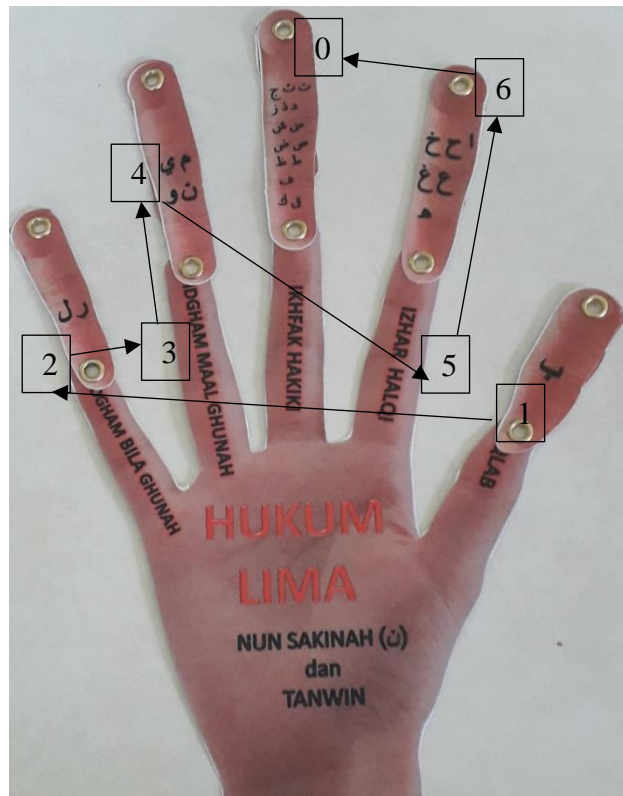
Gambar 2: Penjelasan pembahagian abjad huruf al-Quran mengikut hukum tajwid. yang menggunakan sistem nombor.

mudah serta mempunyai kemampuan untuk mengeluarkan informasi pada bila-bila masa yang diperlukan (Mohd Romei Ngah 2016). Proses pengajaran tahap dua dapat disimpulkan seperti Gambar 2: