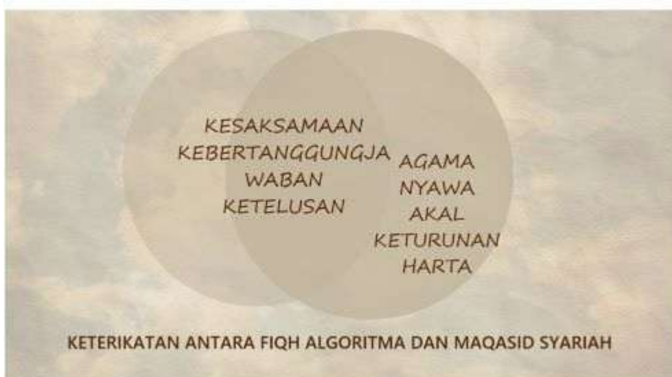
Gambar Rajah 2: Keterikatan di antara Fiqh Algoritma dengan Maqasid Syariah

Apabila meneroka domain baharu yang mempunyai potensi ke arah kebaikan dan keburukan, usaha mengelakkan keburukan perlu diberikan keutamaan berbanding meraih kebaikan berdasarkan objektif Maqasid Syariah.