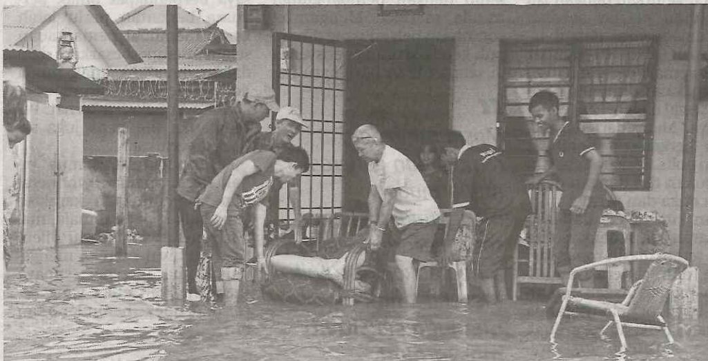
Mangsa menanggung kerugian harta benda akibat banjir.

ialah Pensyarah Kanan Universiti Malaysia Pahang