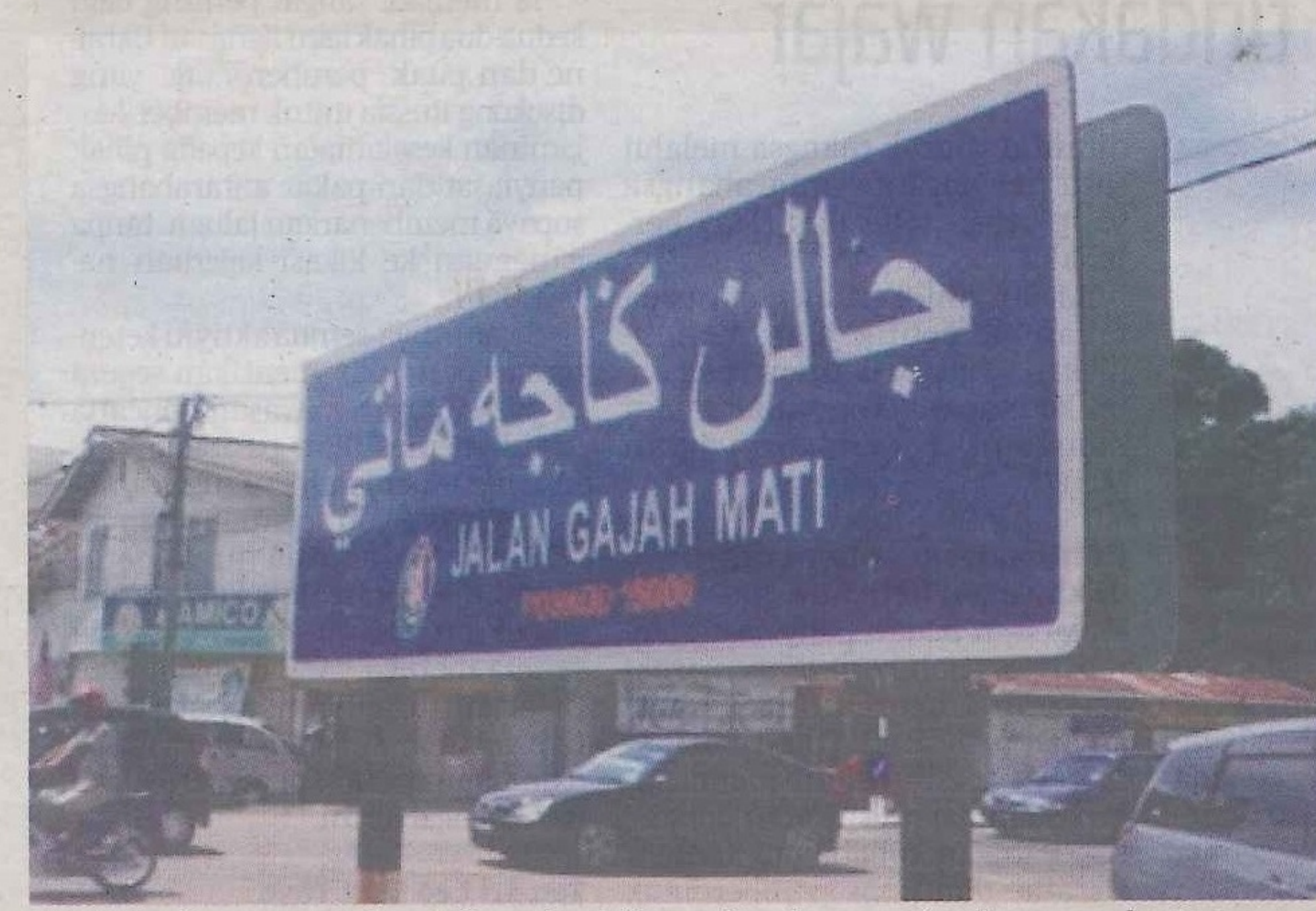
Papan tanda menggunakan tulisan Jawi di samping ejaan rumi pada masa sekarang.