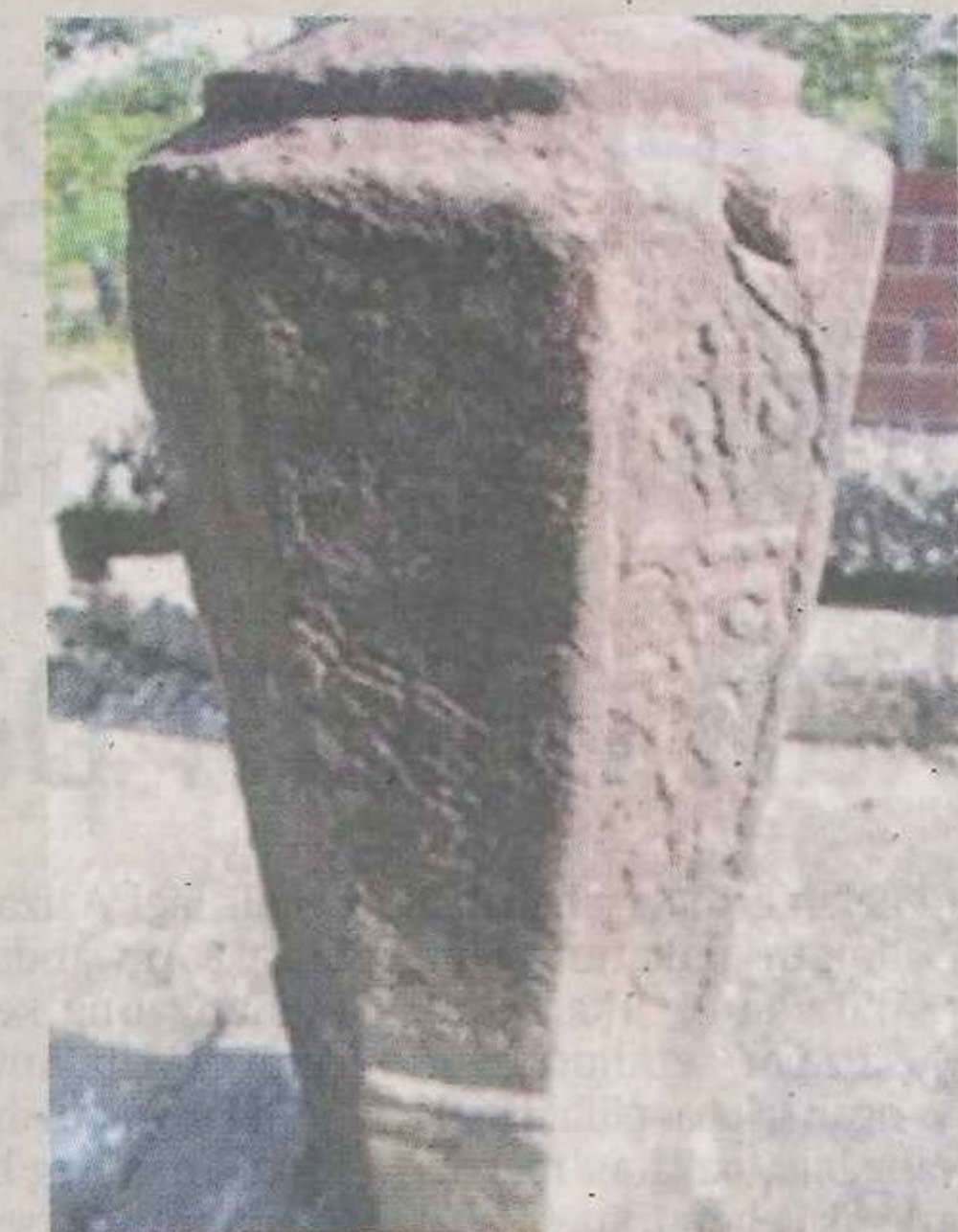
Batu nisan di Leren dikatakan kepunyaan seorang wanita yang bernama Fatimah binti Maimun bin Hibat Allah

Bentuk tulisan jawi pada bukti ini ialah tulisan khat nasakh yang mudah dibaca dan ada menyebut nama Tuhan dengan panggilan 'Dewata Yang Mulia'. Namun kerana usianya yang terlalu lama di samping ia telah digunakan untuk pelapik